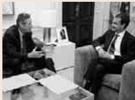
Zapatero y Blanchard, ayer en La Moncloa.

La vicepresidenta primera del Gobierno, María Teresa Fernández de la Vega, aseguró ayer que la economía española volverá a crecer y negó que España haya pedido ayuda económica al Fondo Monetario Internacional (FMI). Durante la rueda de prensa posterior al Consejo de Ministros, De la Vega negó “absolutamente” el rumor de un posible apoyo del FMI al Gobierno español. Además aseguró que la entrevista que mantuvo ayer José Luis Rodríguez Zapatero, en el Palacio de la Moncloa con el economista jefe del FMI, Olivier Blanchard, se enmarca en una visita de “cortesía”.