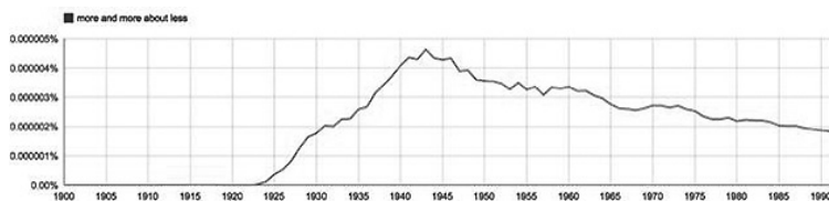
Figure 1 – Fréquence de l'expression « more and more about less » avec Google Ngram (1900-1990)

Les inquiétudes à propos de la spécialisation – « connaître de plus en plus de moins en moins de choses » (« more and more about less and less ») – ont suivi de près le processus de professionnalisation, d'abord enclenché dans les sciences puis plus largement à partir des années 1920. Ce n'est que dans les années 1980 que les historiens des deux rives de l'Atlantique ont commencé à se plaindre du véritable morcellement introduit dans leur discipline par la spécialisation.