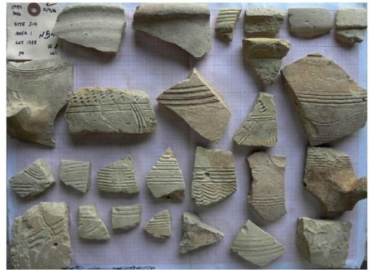
ويئەنى 6 شيۆەى 1: نەمۇنەى پۆلىن كىردنى سەردەمىيەنى گلىنە كۆكرەۋەكانى سەردەمى ئىسلامى لە ۋەرزى 2016 ( لای سەرۋە دەستى چەپ) : ساسانى ( لە گەل ھەندىك لە نەمۇنەى سەرەتەى سەردەمى ئىسلامى )

بەلام لە پىرۆسەى كۆكردنەۋەى دابەش بوونى سەردەمەكان، لە 2016 ئەنجامىكى روپپووى نامۇ بە دەست ھاتوۋە لە بارەى زالبوونى كەل و پەلى كۆتايى سەرتەى سەردەمى ئىسلامى و سەردەمى ئىسلامى ناۋەرەست، C. لە كۆتايى سەدەى 8 و لە سەرتەى سەدەى 13. لە ۋەرزەكانى ئىپاسى EPAS پېشوو بە شىۋازىكى روون ديارە كەۋا ئەم سەردەمە بە ھىۋاشى لاۋاز دەبىت لە رووى تۆمارى گلىنەيەۋە. ئەو شويئە جياۋازەى ناۋچەكە كە لە نشىنگەى سەردەمى ئىسلامى ناۋەرەست MIP لە دەشتى ھەۋلىرە لە لايەن تۆپۆگرافىيەى شويئەۋەرەكان و ھەرۋا نشىنگە چالاكەكان جەختى لە سەر كراۋە. چەندەھا نشىنگەى گەۋرە (بە تايبەتى لە نيوان 20 بۇ 30 ھىكتار)، پېشكەۋەتنى بەخويەۋە بىنيۋە لە ناۋچەكانى نيوان عەۋىنە داغ و گۆماۋەكانى شىۋەسور لە كۆتايى سەرتەى سەردەمى ئىسلامى، بە تايبەت شويئە سادەكان يا خۇد ئەو شويئەۋارانە لە خۇدەگرېت (سايئەكانى 218، 253، 278). تاكوو شويئەۋەرەكان لە ماۋەى سەردەمى ئىسلامى ناۋەرەست بەرفراۋان بوونىيان بە خويەۋە بىنى، كەۋا بە شىۋەيەكى روون نامازەى بۇ كراۋە لە لايەن شىكارى گلىنەيەى (ويئەى 7). بۇى ھەيە ئەم ناۋچانە پشت گوى يا