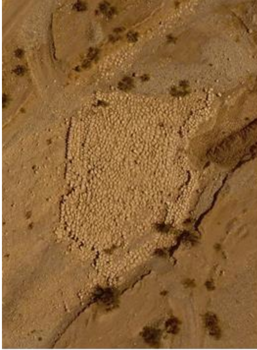
وئىنەى 5: بەردى بەنداو يا پرد لە دۆلى بەستورە

لهوئشەوۈ بەرەوۈ ھەولپىر. بە فرېنىكى نزم بە Drone نەخشەى بۇ كراوۈ. و لە ژېر مەترسى داىبە بە ھۆى بەرد دەرھىنان.