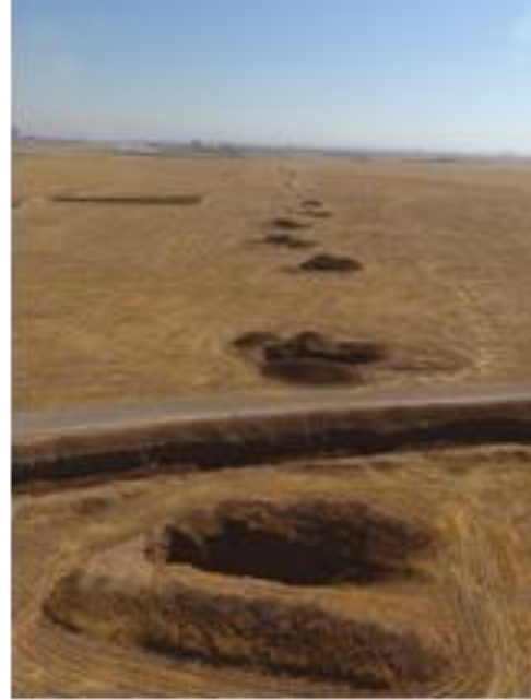
وئىنەى 4: كارىزى نزيك حەزە