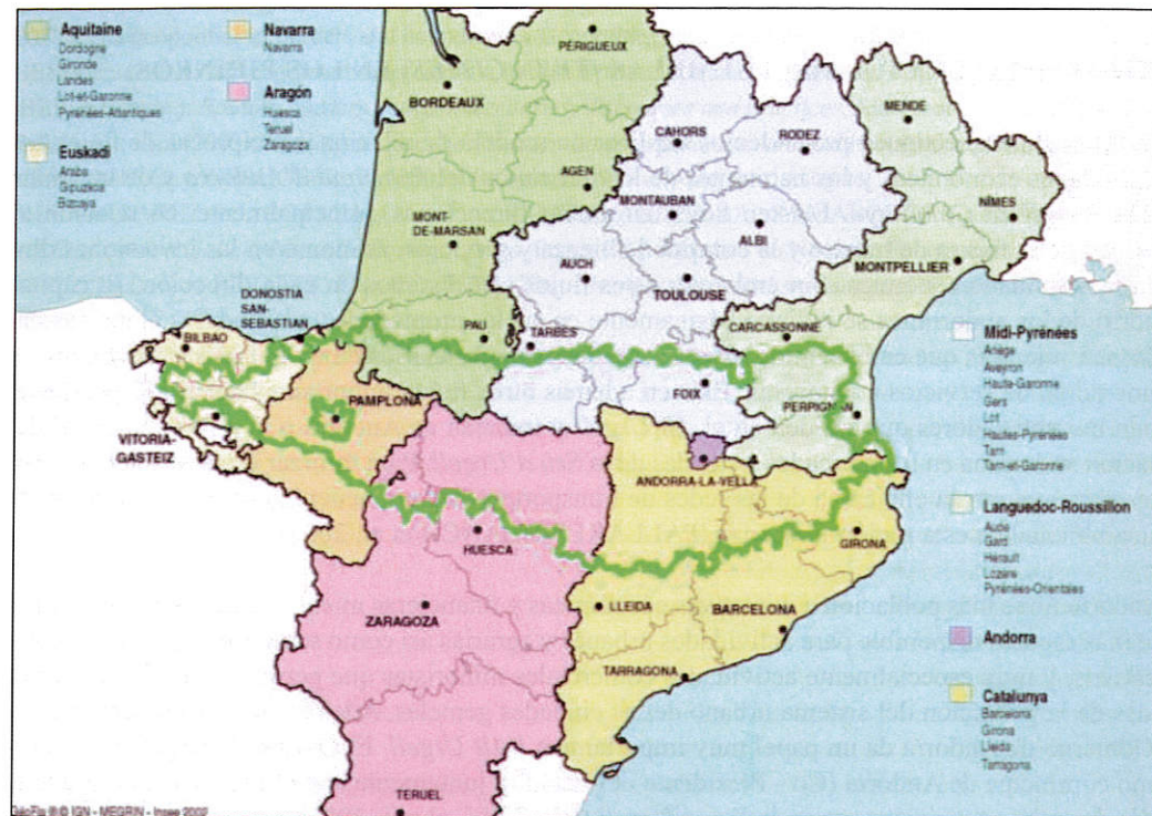
Figura 1: Comunitat de Treball dels Pirineus (CTP).