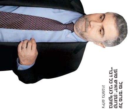
פע פרופ, קוזמקו: “האיש שותע בחקוק גנב כבי דבר אליסו גלמבר”

“ירם האמתיו שהיורו יתפור לנפלא” אבל יוון היא לא הביתה היחידה לרעתן, מפני שהלי הו היה המצב, התספוכת בגיש היורו היתה נפרדת בתוך יום, “יורו היתה מגיעה לוהילת פירעון, עורבת את גזת היורו היינו גומרים עם הסופר – אבל הנה עיתו חרה יותר עמוקות, אירופה חיבת לגבש לצד צמה תוכנית כבהילית. אני חושש שלנוכח המבחרות והתורו לעמוזן בות, המגניבים שבו גידו שחל כסרד למצב רק תקלה כלשהי הם לא עישים שום דבר, הם נעים קדמה רק כשמופעל עליהם לוחץ איירי, וגם אז במקדומים באופן חכי מוגימלי שאפשי. המש- בר רק מחמיר והם צריכים לתמוך בצמיחים גדולים יותר, אבל זה אף פעם לא מנסיק. “המצב היים באירופה הוא בעיקר תוצאה של סעירות של מנהיגים שנעשו לגנב חרבה ופון. היורו המשור בעת, 8