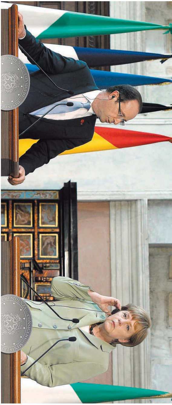
מרקל והונקר – יום תזכיר למספרים שחם צריכים להחזיר חובות מארגנות חברות של אירופה יחד עם גרמניה, הם יצאו שחשומתי” אילום: א.א.סי.טי

אחד לא האמין – היא תשאיר עם גנבל חובות שלי מסקנות המחקר שלי ושל ריינהרט אין לה סוכרי לצי- מר בו בלבד, גם אם הכל יעבור באופן משולם ויון תשאיר עם חוב שלא תורה לה ברידה אלא לגמור לראון מחדש, קשה לדאות איר ייון תצטיי לנטיב לצמצם את התחזרותי בלי בטופו של דבר לצאת מגרונות יחודי, ללעשה, אלמלא היה אפקט ההידרותרק שלו והגדירות בממשבר האומות האירופי, אין ספק שטוב והה את יוון והתה יוצאת מגיש היחיד ועורבת את המי- ערבת והאת.