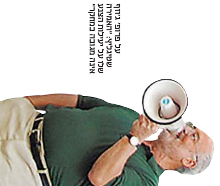
על ערופי גיורף שטיבלר, "אחמתי שול על יעילות והצגת אנו מובנה מתמתי"

למה במדינות לא לומדים ממשברים קודמים? רענונות היבטיות מראת שלמדנום לוקח שנים רבות לחלום ממשברים כלכליים נעמוקים אחריו מתוח רגיל הכלכלה לרוב חוותה לעצמה בודד שנה מוגע