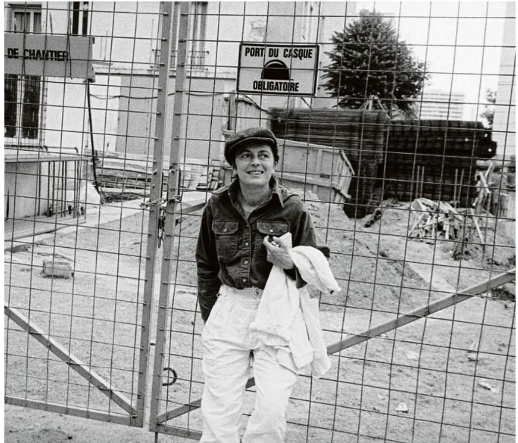
Monique Wittig se faisait appeler «Théo» par ses copines du MLF. Ici, à Paris, en 1985.

De l'autre côté de l'Atlantique, ses idées, rejetées en France, rencontrent au tournant des années 90 les théories queer. Développée ici en France, puis reconnue là-bas aux Etats-Unis, avant de revenir ici mythifiée, sa pensée est typique de ce va-et-vient intellectuel entre